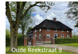
Oude Reekstraat 9

Deze prachtige T-boerderij op nr. 9 is, na volledig afgebrand te zijn, in 2012 in de oorspronkelijke stijl van 1765 herbouwd.