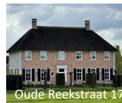
Oude Reekstraat 17

Deze Gelderse T-boerderij lijkt authentiek maar is in 2012 gebouwd door een bouwhistorisch architect.