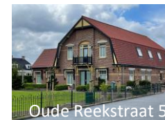
Oude Reekstraat 5