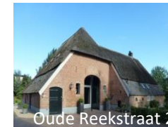
Oude Reekstraat 2

Op nr. 1 staat een boerderij uit 1830. De boerderij op nr. 2 stamt uit 1750. De oudste vorm van deze boerderij was waarschijnlijk een hallehuis. Deze is al voor 1820 uitgebreid tot een krukhuis (heeft L-vorm). De boerderij op nr. 5 dateert uit 1920.