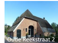
Oude Reekstraat 2

Op nr. 1 staat een boerderij uit 1830. De boerderij op nr. 2 stamt uit 1750. De oudste vorm van deze boerderij was waarschijnlijk een hallehuis. Deze is al voor 1820 uitgebreid tot een krukhuis (heeft L-vorm). De boerderij op nr. 5 dateert uit 1920.