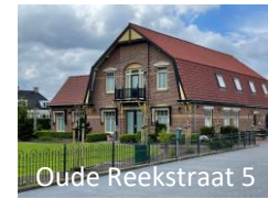
Oude Reekstraat 5