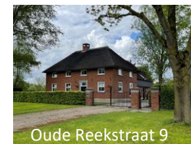
Oude Reekstraat 9