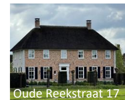
Oude Reekstraat 17

Deze Gelderse T-boerderij lijkt authentiek maar is in 2012 gebouwd door een bouwhistorisch architect.