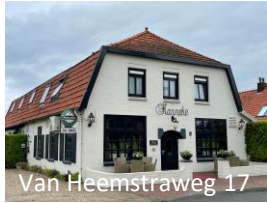
Van Heemstraweg 17