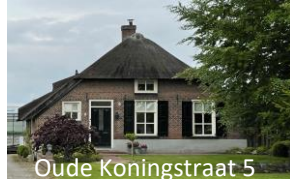
Oude Koningstraat 5