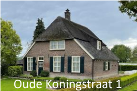
Oude Koningstraat 1