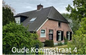
Oude Koningstraat 4