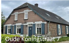
Oude Koningstraat 7