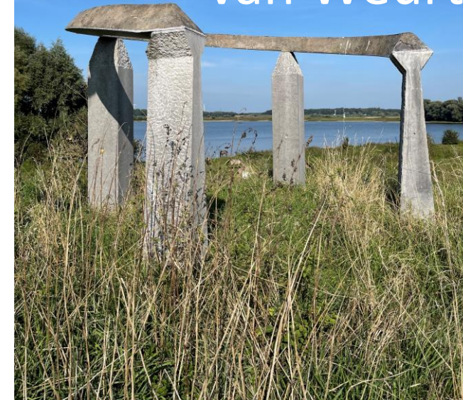
De Dijk (1989-2017) die de vier kerkdorpen verbindt.

De gemeente Beuningen bestaat uit de vier dorpen Beuningen, Ewijk, Weurt en Winssen. Dit ommetje loopt door het dorp Weurt . Deze route laat veel zien van de geschiedenis van Weurt.