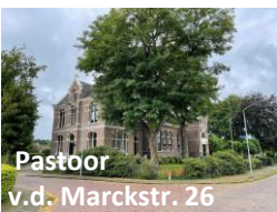
Pastoor v.d. Marckstr. 26

3. Jongensschool met bovenmeesterswoning (1900). Waarschijnlijk gebouwd door dezelfde architect als de Andreaskerk en het klooster.