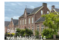
Past. v.d. Marckstr. 14