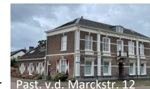
Past. v.d. Marckstr. 12

Markant herenhuis, aanvankelijk T-boerderij. Gebouwd ca 1800. Woonhuis van verschillende burgemeesters.