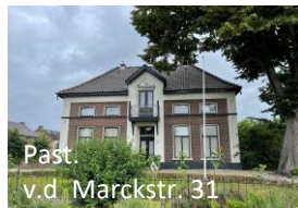
Past. v.d. Marckstr. 31