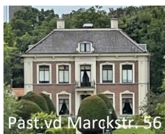
Past. v.d. Marckstr. 56

Plattelandsvilla (1875), gebouwd als T-boerderij door de fam. Braam. Verschillende bouwstijlen, m.n. neoclassicistisch.