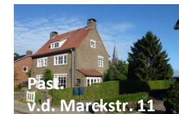
Past. v.d. Marckstr. 11

Gebouwd in de Delftse stijl: nb de hoge kap en de detaillering van het metselwerk rond de ramen.