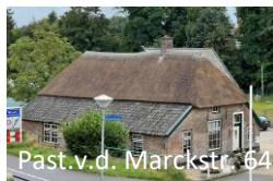
Past. v.d. Marckstr. 64

Laan 1945: In de uitbreiding van Weurt zijn veel straatnamen verbonden met gebeurtenissen uit WO II.