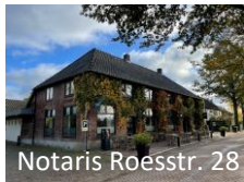
Notaris Roesstr. 28

Dit pand is vanaf 1899 een horeca-gelegenheid, gerund door de inmiddels 5 e generatie van de fam. Tromp.