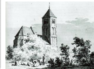
Tekening door Pronk 1732