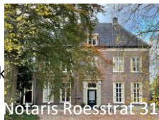
Notaris Roesstrat 31

Hier was het voormalig opvanghuis De Terp. Daarvoor was het de RK pastorie. De nieuwe pastorie is dichterbij de kerk gebouwd.