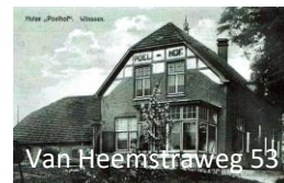
Van Heemstraweg 53