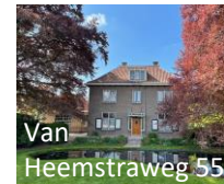
Van Heemstraweg 55

Groot boerderijcomplex met oude kern. Lang bewoond door de rijke, protestantse familie Bloem, die op het kerkhof van de protestantse kerk begraven liggen.