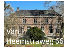
Van Heemstraweg 66

In dit huis woonde ooit de opvolger van de bekende orgelbouwers Gradussen. De lange orgelpijpen konden door de hele hoge deur, nu vervangen door raam en deur boven elkaar. Ook de hijsbalk is nog te zien.