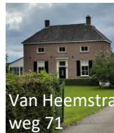
Van Heemstraweg 71