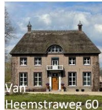
Van Heemstraweg 60