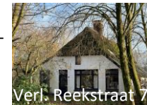
Verl. Reekstraat 7

Boerderijtje uit 1915. De Reekstraat vormde de grens, dus ze kant van de weg viel nog heel lang onder het dorp Weurt.