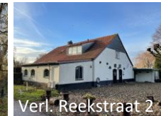
Verl. Reekstraat 2