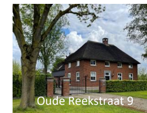
Oude Reekstraat 9