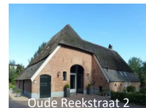
Oude Reekstraat 2

Op nr. 1 staat een boerderij uit 1830. De boerderij op nr. 2 stamt uit 1750. De oudste vorm van deze boerderij was waarschijnlijk een hallehuis. Deze is al voor 1820 uitgebreid tot een krukhuis (heeft L-vorm). De boerderij op nr. 5 dateert uit 1920.