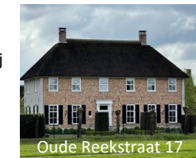
Oude Reekstraat 17

Deze Gelderse T-boerderij lijkt authentiek maar is in 2012 gebouwd door een bouwhistorisch architect.