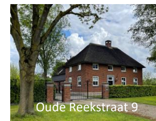
Oude Reekstraat 9