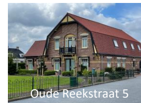
Oude Reekstraat 5