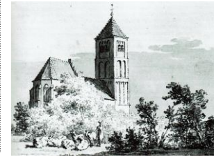
Tekening door Pronk 1732