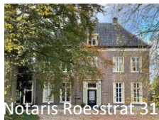
Notaris Roesstrat 31