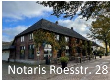
Notaris Roesstr. 28

Dit pand is vanaf 1899 een horeca-gelegenheid, gerund door de inmiddels 5 e generatie van de fam. Tromp.