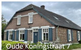
Oude Koningstraat 7