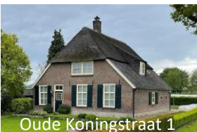
Oude Koningstraat 1