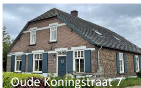
Oude Koningstraat 7