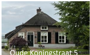
Oude Koningstraat 5