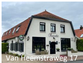
Van Heemstraweg 17