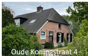
Oude Koningstraat 4