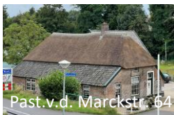
Past. v.d. Marckstr. 64