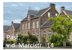
Past. v.d. Marckstr. 14