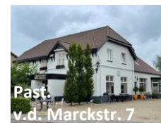
Past. v.d. Marckstr. 7