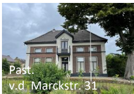
Past. v.d. Marckstr. 31