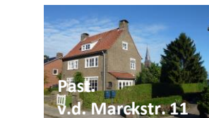
Past. v.d. Marckstr. 12

Gebouwd in de Delftse stijl: nb de hoge kap en de detaillering van het metselwerk rond de ramen.