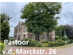
Pastoor v.d. Marckstr. 26

3. Jongensschool met bovenmeesterswoning (1900). Waarschijnlijk gebouwd door dezelfde architect als de Andreaskerk en het klooster.