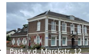
Past. v.d. Marckstr. 12

Plm. 1906. Aanvankelijk gebouwd voor Ursulinen, die een meisjes- en bewaarschool oprichtten. Later bewoond door paters Maristen.