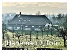
(Haneman 2, foto)

Hallehuisboerderij waarvan het oudste deel al uit de 17 e eeuw dateert. Mogelijk is deze hoeve niet de oorspronkelijke Kleyne Haneman, die lag vlg een polderkaart aan de andere kant van de weg.